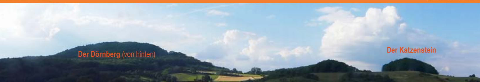
Der Dörnberg (von hinten)